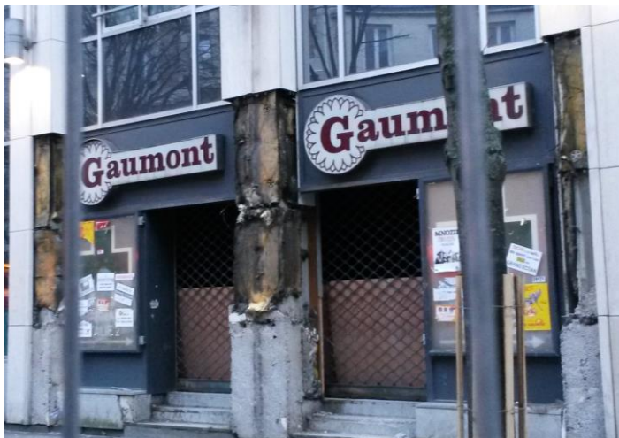
Grand Ecran Italie (Petites salles en travaux – févr.15)

Enfin, les sociétés ont aussi accès aux immenses possibilités du Gaumont Italie pour y organiser toutes sortes d'opérations ou de manifestations de prestige. Tout est prévu pour leur donner satisfaction, proportionnellement à l'ampleur de la soirée souhaitée : utilisation de la grande salle, des deux salles de 100 places aux qualités de projection exceptionnelles, la scène, l'équipement technique, l'espace cocktail pouvant accueillir jusqu'à 500 personnes, les dépendances (vestiaires, salle de réunion, cuisine équipée), la vitrine d'exposition.