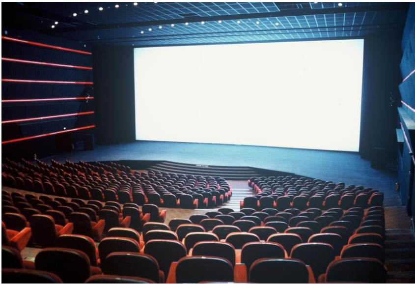
Grand Ecran Italie (Grande salle)